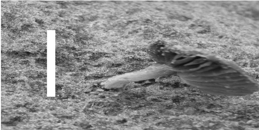
Figura 2: Vista lateral de carpóforo de fungo do gênero Gymnopilus encontrado na Praia do Cassino-Rio Grande-RS, Brasil (escala:3cm).