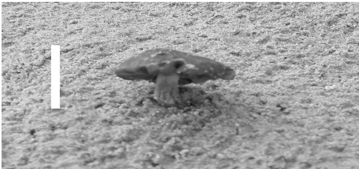
Figura3: Carpóforo, evidenciando píleo e estipe de exemplar do gênero Gymnopilus encontrado em duna, Praia do Cassino, Rio Grande-RS, Brasil (escala: 3cm).

Campos (1991) e Susin & Campos (1995) pesquisando fungos agaricóides em diversos ambientes, cita o gênero Gymnopilus , associados a vegetais