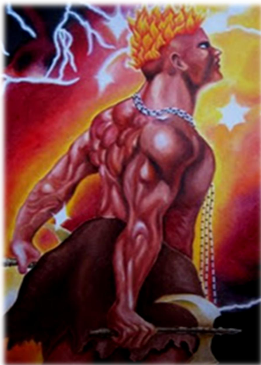
Figura 4 - Xangô orixá da justiça elemento fogo, sincretizado a São Jerônimo