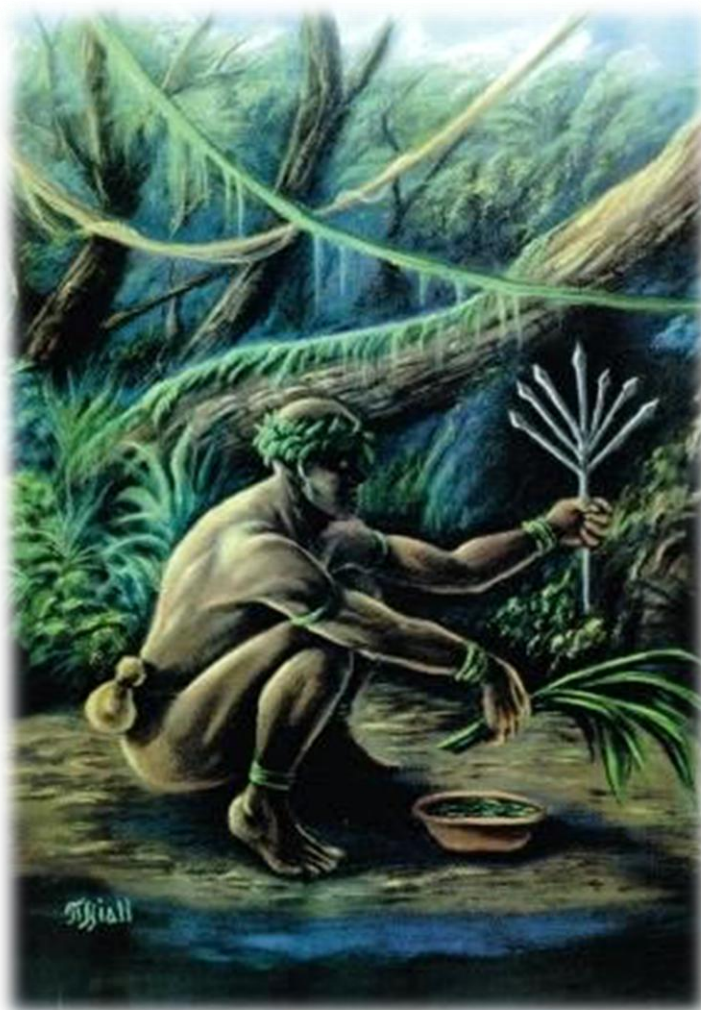
Figura 6 – Ossanha, Orixá protetor das matas, conhecedor dos segredos medicinais das folhas. Elemento: terra.