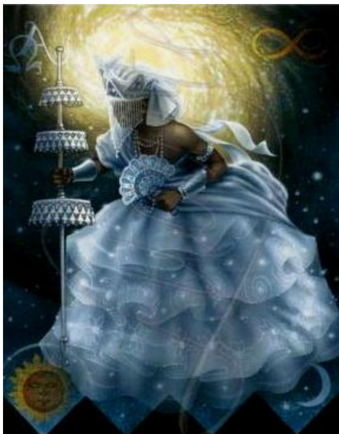
Figura 8 - Oxalufã elemento ar, orixá da paz, o amor universal.

impor-se como ortodoxia, tornando-se, então, perseguidor e reprimindo, do seu jeito, qualquer heresia. O socialismo ficou várias décadas incubado antes de emergir, no fim do século XX, sob a primeira forma do partido social-democrata alemão. O alerta ecológico, dado em 1968, foi ignorado, contestado, sendo que a consciência do perigo sobre a biosfera permaneceu marginal durante duas décadas, até suscitar uma primeira tomada de consciência mundial, concretizada nas conferências do Rio de Janeiro (1992) e Kioto (1997). Os sistemas despóticos e totalitários sabem que os indivíduos portadores de diferenças constituem um desvio potencial; por isso, os eliminam a aniquilam os focos de desvio. (MORIN, 2012, p.135).