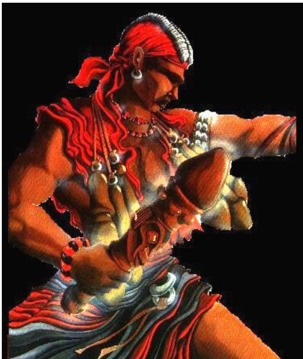
Figura 1 - Orixá Bará sincretizado a São Pedro, mensageiro entre os homens e os orixás elemento fogo.

do contato entre os dois saberes para que interajam tanto na comunidade quanto na comunidade acadêmica com a sua participação no processo de divulgação da sua história, cultura e principalmente do seu saber ancestral sobre a cosmovisão de educação ambiental.