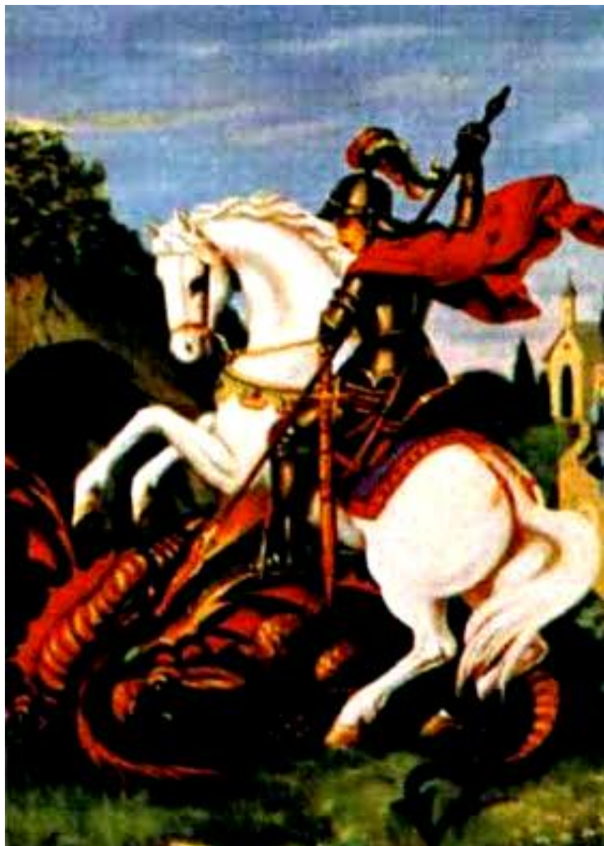
Figura 3 - São Jorge, Patrono da Umbanda. Sincretismo com Ogum.