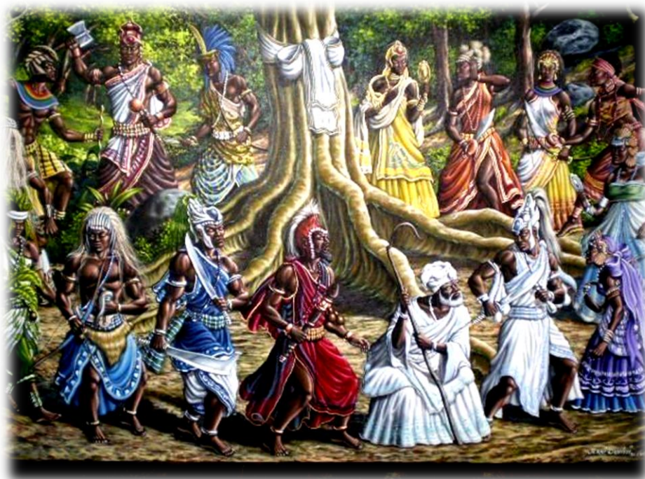
Figura 5 - Roda dos Orixás ou xirê representação da hierarquia dos Orixás.

A roda dos orixás representa a cosmovisão do universo e da concepção de educação ambiental, de respeito à natureza dentro do culto Jeje-Nagô transmitido através da oralidade ou, como dizem os iniciados, “o segredo da religião dos orixás é de boca e ouvido”, onde cada iniciado tem o seu próprio amadurecimento espiritual e, sendo assim, recebe os ensinamentos dentro do tempo apropriado, conforme a decisão do sacerdote ou sacerdotisa, devendo agir com discrição, mantendo o segredo sobre os ensinamentos recebidos dentro da comunidade religiosa.