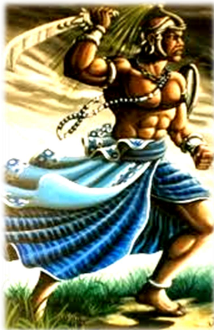
Figura 2 - Orixá Ogum da justiça e dos caminhos. Elemento fogo, sincretizado a São Jorge.