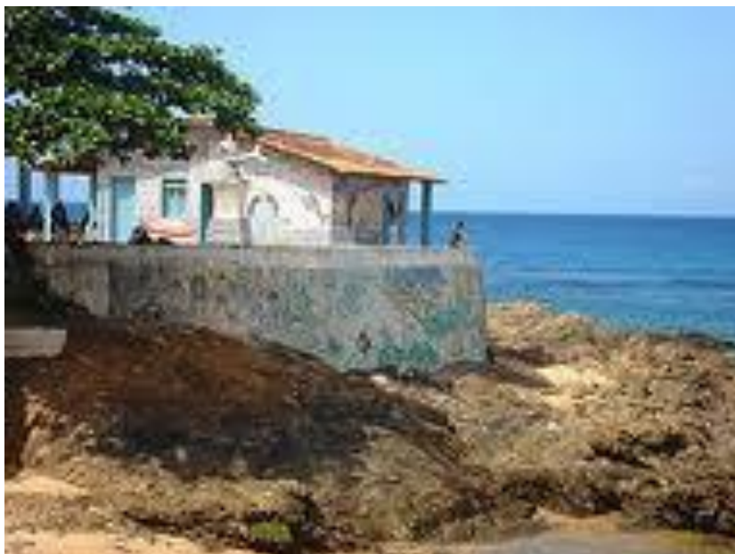
Fotografia 3 - Casa de Iemanjá 17 antiga casa do peso bairro Rio Vermelho Salvador.

voltada aos saberes, tanto no âmbito científico como no censo comum, realizando uma leitura deste saberes e buscando ser mais, ao ampliar seu olhar com o propósito de somar, e não de dividir.