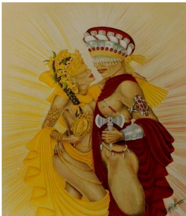
Figura 7 - Oxum e Xango