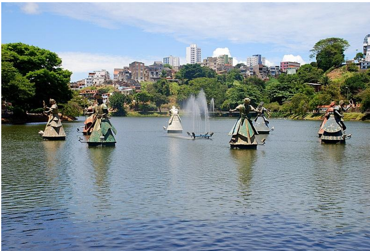
Fotografia 1 - Monumento Orixás 13 localizado no Dique do Tororó Salvador, BA. Obra do artista plástico Tati Moreno em 1998.

Eu entendo a concepção de Edgar Morin como um elo para a compreensão entre o ser humano, o ambiente e a importância dos orixás através de sua representação de natureza como um todo, onde as partes são importantes juntas, e não fragmentada; pois, ao buscarmos compreender uma das faces da religião da matriz afro-rio-grandina que faz parte de um universo complexo da religião afro-brasileira, chegamos a concluir que as partes não são nada sem o todo. E por este fator, nós realizamos um breve histórico desde a escravidão, a formação do campo umbandista, do sincretismo para a nova construção de identidade da valorização dos elementos africanos e de sua cosmovisão de relação do ser humano com o ambiente para entendermos o processo atual no qual a religião está inserida.