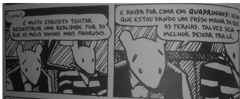
Figura 4 – Imagem retirada do livro Maus: a história de um sobrevivente (2009, p. 176)

O personagem Art Spiegelman se questiona em várias passagens do texto se é possível para ele ocupar o papel de narrador da obra, visto que não vivenciara o holocausto diretamente. Os efeitos do holocausto são sentidos por ele na relação com os pais, e em seu discurso torna-se claro que as desventuras que vivenciou em virtude do evento em nada se comparam às vivenciadas diretamente por seu pai.