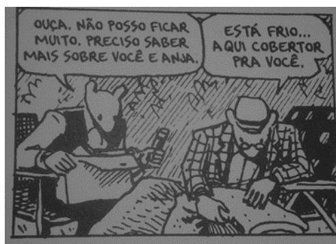
Figura 6 – Imagem retirada do livro Maus: a história de um sobrevivente (2009, p. 137)

Bauman demonstra que a necessidade de se permear no mundo é inata ao indivíduo. Já que o evento da morte é inevitável, talvez consigamos projetar a nossa sombra nas gerações futuras. O ditado popular “tenha um filho, plante uma árvore ou escreva um livro” é prova de que a necessidade de permanecer e não ter nossas existências apagadas é comum a todos os sujeitos. Na passagem acima, temos essa preparação para reconhecimento póstumo negado a alguns indivíduos. Para os que morreram o final da existência torna-se apenas um número no evento do holocausto, ainda que este impacto seja sentido e referenciado pelos seus descendentes.