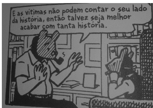
Figura 5 – Imagem retirada do livro Maus: a história de um sobrevivente (2009, p. 205)

Assim, a narração do holocausto é posta em xeque não apenas na figura deste narrador, mas de quaisquer autores que entrem neste empreendimento. O evento marcado pela morte, pode ser narrado por sobreviventes? Se assim não o for, não há legitimidade nestas narrativas, pois os mortos não têm mais voz e foram os que sofreram o holocausto até as últimas consequências e perderam sua vida neste episódio.