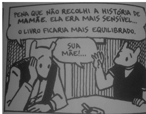
Figura 7 – Imagem retirada do livro Maus: a história de um sobrevivente (2009, p. 134)

Esse cuidado nos leva ao encontro da concepção de história de Sarlo já que não há como narrar sem marcar a subjetividade, ela é parte integrante do relato. Spiegelman se vale dessas cenas para introduzir ao leitor o contexto de aquisição do relato, recorte narrativo dado pelo seu pai e pela realidade na qual estava inserido e pelo narrador que remonta o relato e os transporta para os quadrinhos.