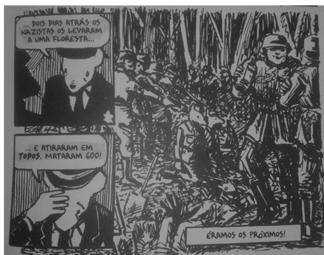
Figura 11 – Imagem retirada do livro Maus: a história de um sobrevivente (2009, p. 63)

inexistência da narrativa de sua mulher fora ocasionada por ele mesmo a algum tempo para esquecê-la. As lembranças não podem ser destruídas, nem suas cicatrizes, mas uma prova física pode. O ato de destruição do diário é uma tentativa de superação do passado através do esquecimento. Sarlo (2007) aborda várias catástrofes dentre elas o holocausto e pontua a dificuldade da narração precisamente pela vontade de não reviver lembranças que fazem o narrador sofrer.