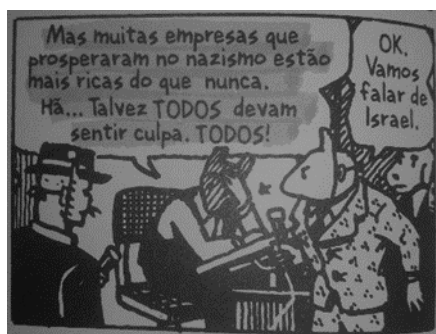
Figura 1 – Imagem retirada do livro Maus: a história de um sobrevivente (2009, p. 202)

Na imagem acima, há uma denúncia do afã da sociedade de ler o holocausto como algo circunspeto à comunidade judaica, corporificada na palavra de “Israel” proferida pelo repórter em resposta a uma responsabilização geral, defendida pelo personagem Art. O protagonista redimensiona o episódio para o mundo e à sociedade, deixando claro que a todos cabe a tarefa de lembrar ou de esquecer tais acontecimentos. Todavia, é importante salientar que, tais processos não são concorrentes e perpassam o indivíduo em diversos momentos da narrativa de Spiegelman. A questão que se apresenta no cerne da escrita do autor, e que buscamos analisar no presente trabalho, não é apenas o que é história ou o lugar dela e da literatura, mas o que se quer como parte integrante da história e o porquê. O holocausto foi um evento atroz de proporções mundiais que não se encerra com a libertação dos presos, mas permanece até os dias de hoje como ferida de todas as sociedades e continua sendo uma sombra para os sobreviventes e seus descendentes.