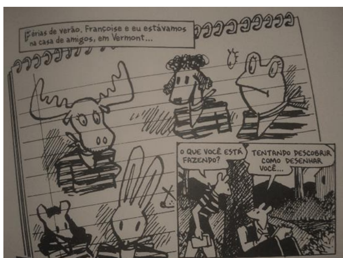
Figura 2 – Imagem retirada do livro Maus: a história de um sobrevivente (2009, p. 171)

Na passagem acima Campbell pontua que a mitificação, ajuda a lidar com o que, conscientemente, não se consegue manejar. No caso do holocausto, a representação da história poderia ajudar na superação do trauma. A partir da mitificação, aceita-se melhor o que se sofre e os medos que são enfrentados. Campbell, nesse sentido, trata a mitificação como inerente a toda a cultura humana e aos rituais rotineiros.