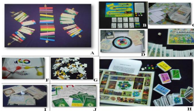
Figura 1 – Jogos do projeto

A) Equilíbrio Ambiental; B) A Casa Eficiente; C) Objetivos do Milênio; D) Carta da Terra; E) A Rota do Lixo; F) O Sustentar; G) Quebra-cabeça; H) Banco do Planeta; I) Jogo dos 3R's; J) Pegada Ecológica.