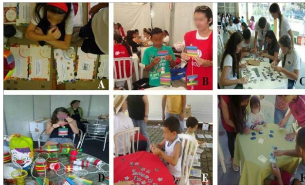
A) Colégio São Paulo; B) Viva Praça – Vespasiano/MG; C) Caravana SEMA, Contagem /MG; D) Praça da Liberdade, BH/MG; E) III ExpoUNA; F) IV ExpoUNA.