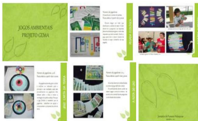
figura 2 – Catálogo de jogos.