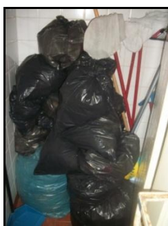
Figura 4 – Local de armazenamento de lixo reciclável

Esta etapa visou a participação de toda a comunidade, em especial das higienizadoras que atuam no CEng. A primeira visita técnica ocorreu após conclusão da etapa de implementação, na qual se observou a geração de 10 sacos de 20L, de cor preta, estabelecendo uma média de 0,3 sacos/dia. Em vistoria semanal posterior à data, em um período de um mês, a segregação no local transcorreu de maneira significativamente eficaz. Os sacos analisados encontravam-se fechados, armazenados em local ao abrigo de intempéries como luz, calor e chuva, como mostra a Figura 4.