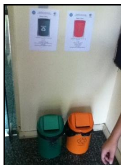
Figura 3- Lixeiras e seus respectivos cartazes de identificação para resíduos orgânico e reciclável.

As lixeiras antigas foram substituídas pelo o conjunto de lixeiras novas. Após foi recolhida a assinatura dos responsáveis por cada setor e a fixação de cartazes indicativos, como mostra a Figura 3.