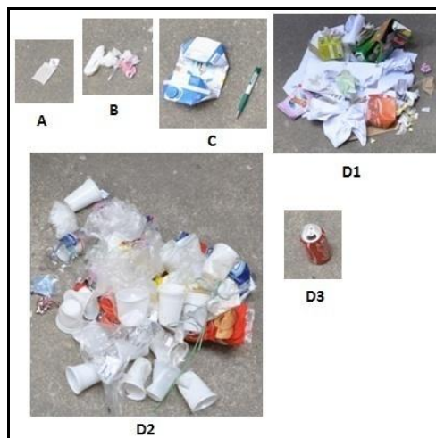
Figura 5 – Análise de um saco de lixo segregado no local

No entanto, nos reservatórios analisados, estes representavam uma quantidade muito pequena comparada à quantidade de lixo reciclável (D), como mostra a Figura 5.