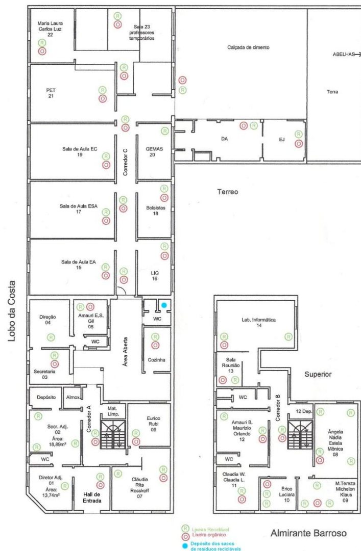
Figura 2 – Planta baixa do CEng com a disposição das lixeiras.

Mediante a parceria com uma cooperativa de reciclagem, realizada pela Coordenadoria de Gestão Ambiental da UFPel, ficou acertada a coleta externa semanal dos resíduos recicláveis (papéis, vidro, metais plásticos), os quais são armazenados individualmente na sala de armazenamento de resíduos na parte interna da unidade.