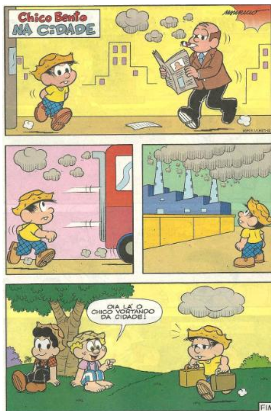
Figura 1: SOUSA, 2013, n°: 75, p. 15.

abaixo, podemos analisar enunciações e visibilidades que demonstram esse discurso pré-estabecido.