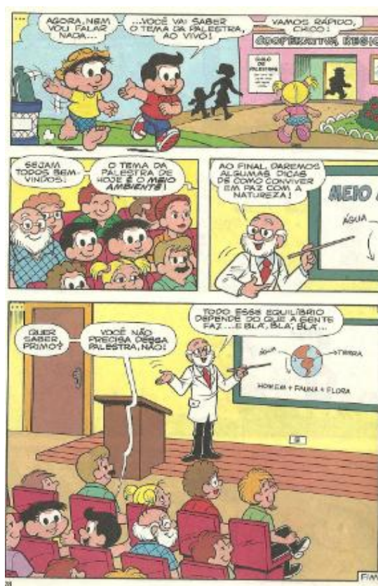
Figura 2: SOUSA, 2013, n°: 66, p. 28.

A imagem na HQ da figura nº1 apresenta a cidade poluída, com lixo jogado na calçada, nuvens acinzentadas, escapamento de um ônibus emitindo fumaça poluente e as chaminés da fábrica contaminando o ar com a liberação do vapor das máquinas. Chico Bento aparece logo em seguida com suas malas, retornando ao ambiente rural, decepcionado com o que viu na cidade. Nessa enunciação, visível nas imagens, os aspectos de uma vida saudável associada ao ar livre e puro, às árvores e ao verde, sinalizando um ideal de natureza, estão explícitos e expressam um olhar recorrente orientado pela formação discursiva que dá sentido ao enunciado.