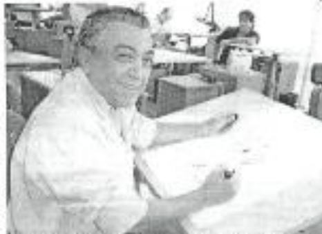
Maurício de Sousa em uma reunião de trabalho em sua empresa em São Paulo.

Atualmente, Maurício de Sousa é o maior empresário brasileiro de mídia infantil. Seu império midiático, a Editora Globo, possui uma receita líquida de R$ 1,2 bilhão em 2009, com uma base de assinantes de mais de 10 milhões de pessoas. O empresário planeja dobrar sua receita em mercados emergentes até 2012, com foco especial no Brasil e na América Latina.