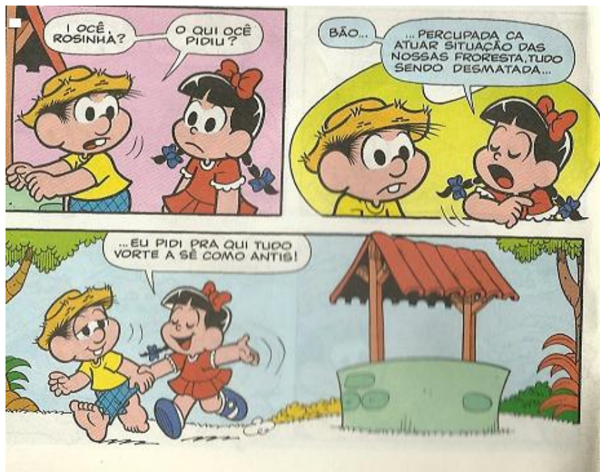
Figura 5: SOUSA, Almanaque, 2010, nº 20, p. 8.

discurso, ao enaltecerem o estilo de vida rural, o fazem demonstrando uma natureza romântica domesticada, humanizada; portanto, civilizada nos moldes da cultura ocidental. Podemos pensar sobre isso a partir da visibilidade disponível nas imagens e na enunciação selecionadas a seguir: