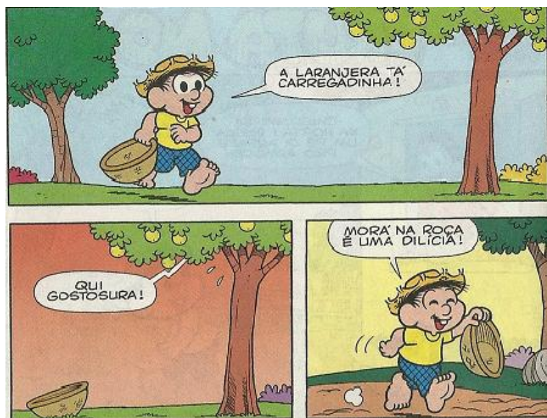
Figura 4: SOUSA, 2012, nº 71, p. 22.

Como explicitam as imagens e a enunciação (SOUSA, 2012, nº 71, p. 22) – “Morá na roça é uma delícia!” – a natureza é rica, as frutas são saborosas, a roça é uma delícia; enfim, esse olhar ideal se desenvolve em parte como uma nova funcionalidade do discurso de natureza constituído diante dos problemas ambientais que caracterizam a Modernidade na fase atual. Assim, passamos a problematizar o utilitarismo instituído pela Modernidade no que diz respeito às relações que são estabelecidas com a natureza não humana.