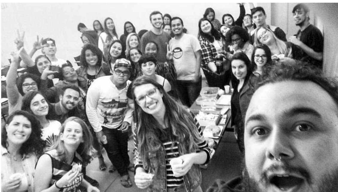
Foto 2. Com a turma de educandos/educandas e educadoras/educadores da última confraternização do ano de 2016. Fotos do acervo do pesquisador.