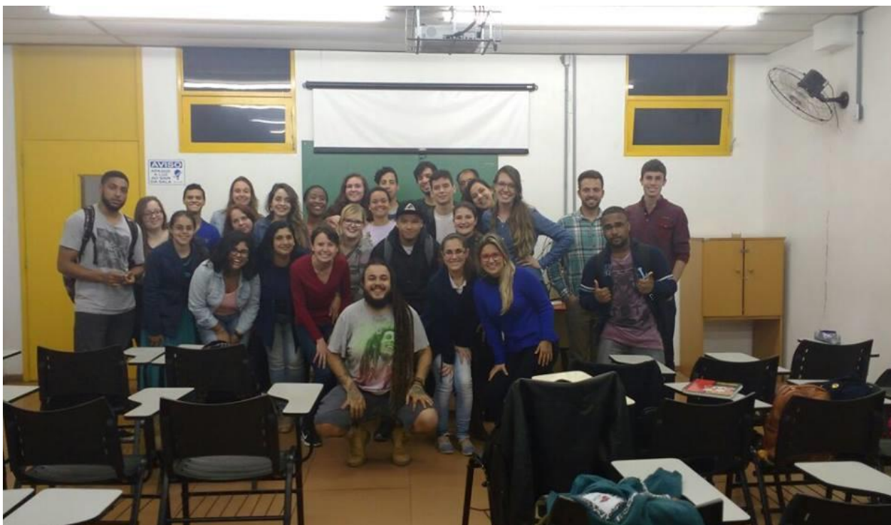
Foto 1. Turma do Paidéia do ano letivo de 2016. Última aula de História.