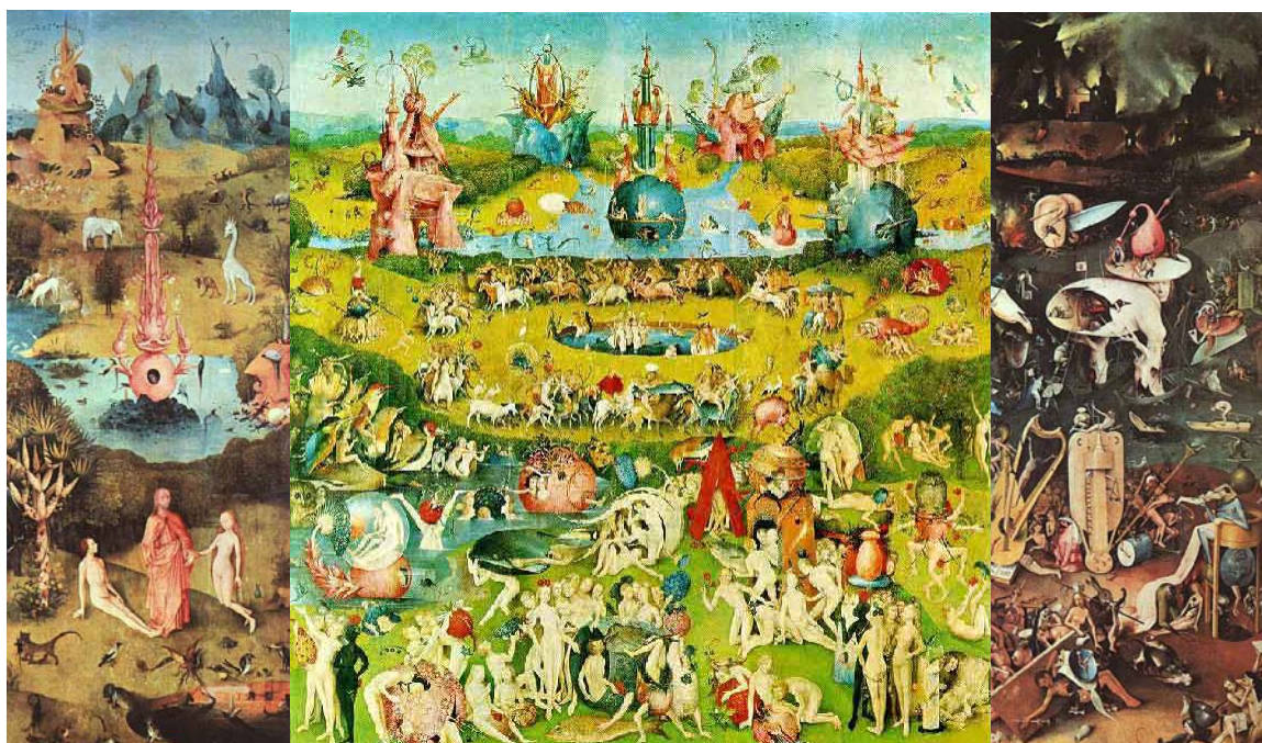
FIGURA 06 – O Jardim das Delícias Terrenas. Hieronymus Bosch (1450-1516)

enquanto o terceiro é uma referência ao Jardim das Delícias (painel central). O todo do painel nos mostra o ideal de conduta, a fragilidade humana, e o inferno a quem ceder os desejos da “carne”, por isso a tela retrata situações de luxúria que envolvem cavalheiros, clero, mendigos, penitentes, masturbadores, homossexuais, estropadores, santos e demônios, tudo envolto em figuras grotescas e exóticas.