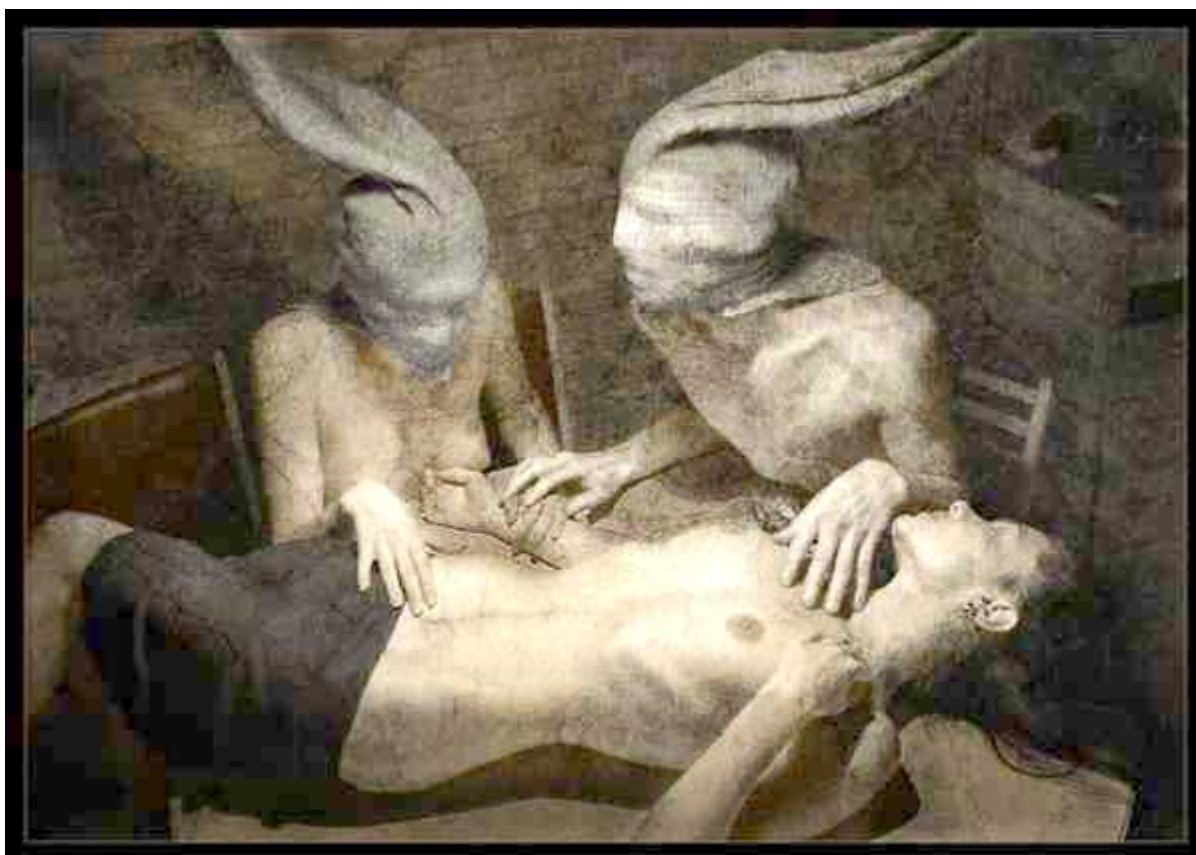
FIGURA 1 – Eugene Kozhevnikov – Fotografia – Prisoners of Desire (2006)

Pandora (in memorian) – por mais que o tempo passe, jamais vou esquecer o momento em que nossos olhos se cruzaram, e mesmo no silêncio realizamos um agradecimento mútuo por estarmos juntas em uma situação tão singular, que somente nós duas vivenciamos.