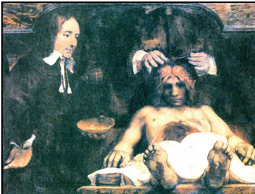
FIGURA 03 - Rembrandt – Aula de Anatomia do Dr. Deyman (1656)

O quadro retrata claramente: quem o realiza ainda corria o risco de ser execrado por ter esse ofício. Nesse momento da história do estudo do corpo, esse ofício estava parcialmente aceito; nem sempre foi assim, e talvez a imagem parcial mostre reminiscências de temores advindos do clero devido a editos de proibições nessa área do conhecimento. Essas proibições ficam estabelecidas quando o Papa Bonifácio I (século XIV), através do edito, proíbe as dissecações de cadáveres em nome da “dignidade humana”, mas poderia ocorrer a autópsia, o embalsamento e a vivissecação de animais – mas furtivamente para estudos e correndo riscos exumava-se cadáveres roubados de cemitérios ou os corpos condenados à forca que, descidos do cadafalso, eram direcionados para a mesa de estudos. Ocorrem inclusive registros de casos de vivissecação de condenados à morte: era o poder do saber sobre o corpo vivo, tanto no poder médico como no poder do clero, que não descuidava do governo da alma, do poder sobre os corpos.