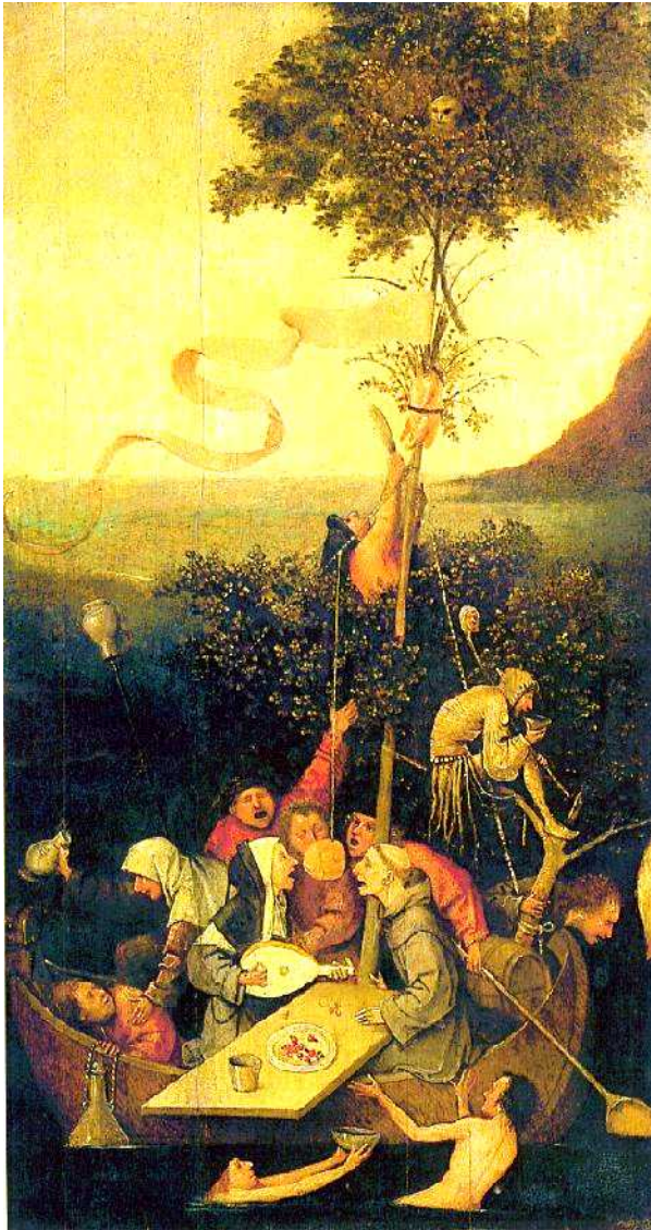
FIGURA 04 – O Navio dos Loucos. Hieronymus Bosch, Século XV

Cotidiano de um século de exclusão do louco, muito bem retratada pela pintura de Hieronymus Bosch – O Navio dos Loucos – ou A Nave dos Loucos. Uma análise dessas telas que retratavam a exclusão bizarra é comentada pela autora Keil: “A Idade Média cristã produziu seus excluídos e os retratou em suas telas. É bizarra essa necessidade dos homens de construir um corpo infame para excluí-lo: marginalização imposta, medo do Outro e desejo de destruí-lo”. (TIBURI, KEIL, 2004, p. 159)