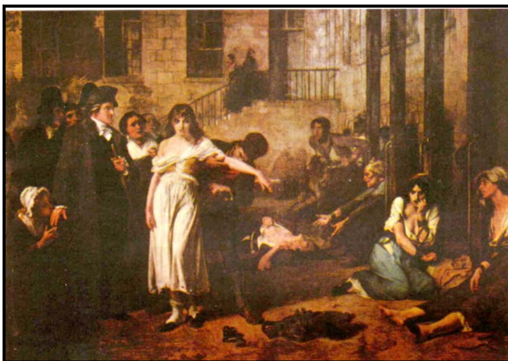
FIGURA 05 - Philippe Pinel e as Loucas. T.R.Fleury – 1837-1912

Sua carga negativa se mantém viva através dos tempos e esteve sob supervisão ferrenha na Idade Média; como já descrevi, os masturbadores eram, entre outras insanidades, partes dos tripulantes da “Nau dos Loucos” do século XV.