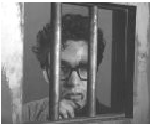
FIGURA 7 – Cena de Frei Tito preso e torturado

primeira, marcada pela ironia, quando da citação de Frei Tito, em que o Juiz retira de seu depoimento as partes em que o jovem se referiu à tortura sofrida na prisão e no momento em que o advogado do frade exige que a denúncia conste no depoimento, o magistrado responde: “A tortura é tão terrível que não deve nem sequer ser mencionada”. A pergunta imediatamente formulada é: Mas pode ser empregada? Podemos ver na Figura 7 o personagem Frei Tito preso e torturado.