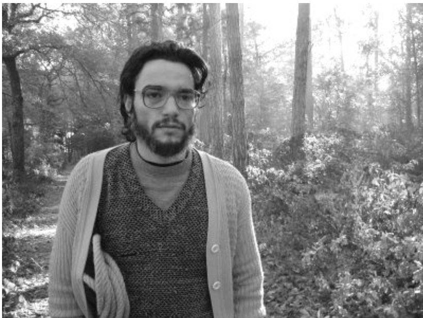
FIGURA 8 – Cena em que Frei Tito segue para o suicídio