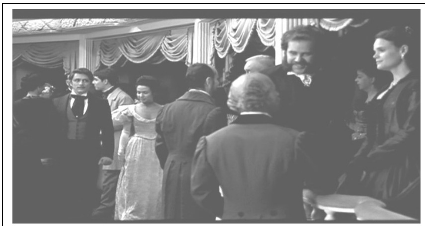
FIGURA 3 – Brás no teatro.

Fonte: fotografia do filme Memórias póstumas de Brás Cubas .