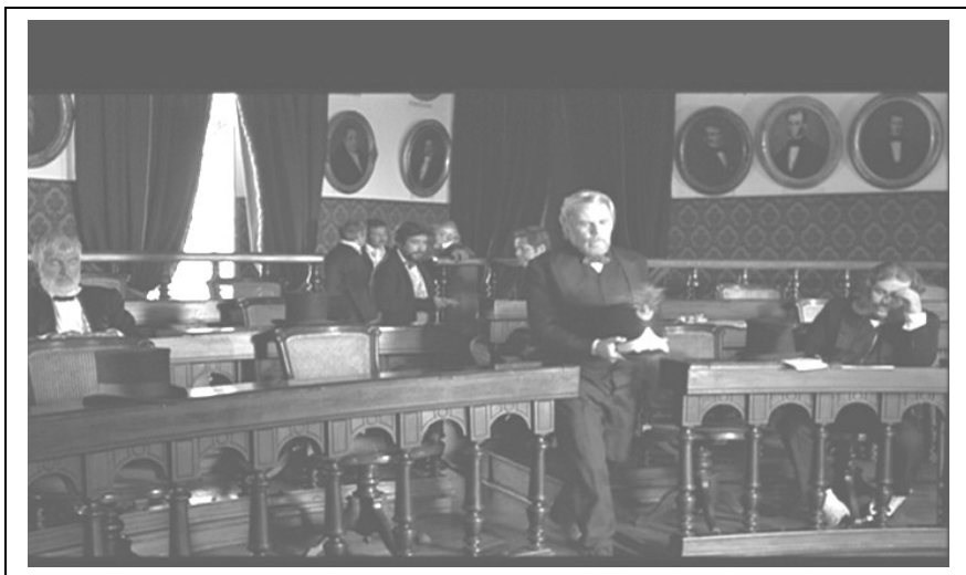
FIGURA 4 – Brás discursa na Assembléia.