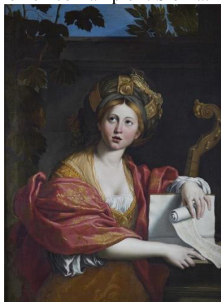
Figura 1. Domenico Zampieri. Sibilla. Roma. 1617.

A mulher poderia então usar de seus poderes para o bem ou para o mal, podendo ser, conforme pontua Michelet, fada ou bruxa. Nasce fada, pois o ser humano, quando nasce, é puro, ainda não foi exposto ao mundo e às suas mazelas. Com o tempo, pode se tornar bruxa, dependendo de como a sociedade a tratar.