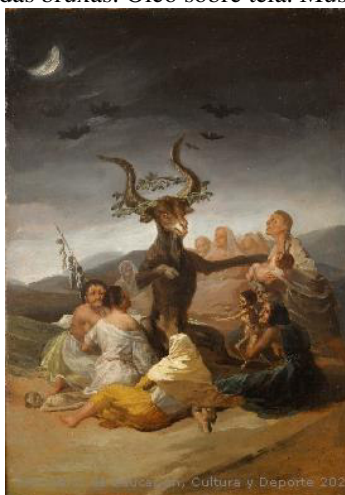
Figura 2. Francisco de Goya. Sabá das bruxas. Óleo sobre tela. Museu Lázaro Galdiano. Madri. 1797-8.

Idade Média relacionado à bruxaria. Segundo esse documento, conforme destacam Russell e Alexander, algumas mulheres eram pervertidas pelo Diabo e seduzidas por demônios; elas afirmavam cavalgar à noite certos animais junto a muitas outras mulheres, além de Diana, deusa dos pagãos, que seria a líder, e que chamaria essas mulheres a servi-la em certas noites. “Voos, batalhas, homicídios seguidos de atos de canibalismo e da ressurreição das vítimas: eis os ritos imaginários que, durante determinadas noites, a deusa impõe a suas seguidoras.” (GINZBURG: 2021, p.108).