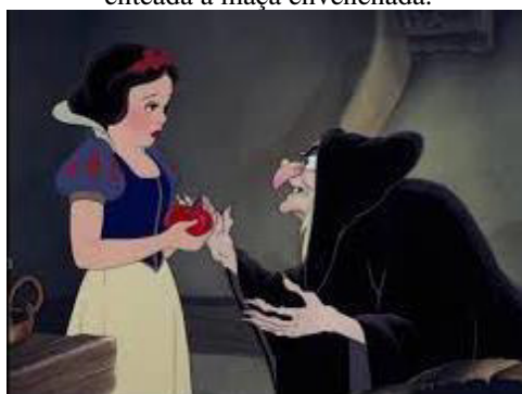
Figura 5. Cena de “Branca de Neve e os sete anões”, filme de Walt Disney de 1937. A madrasta disfarçada dá à enteada a maçã envenenada.

Diferentemente do que nos é mostrado no desenho lançado por Walt Disney em 1938, na história original dos Irmãos Grimm, muitas são as invenções da madrasta para tentar matar Branca de Neve: primeiro, ordena a um caçador que mate a menina, conforme já mencionado. Porém, ao descobrir que o mesmo não havia cumprido sua missão, decide disfarçar-se: “Pintou o rosto e vestiu-se como uma velha vendedora ambulante, tornando-se completamente irreconhecível.” Fazendo uso do disfarce, a madrasta enfeitiça um cadarço para o corpete da moça, seguindo para um pente envenenado e, por fim, a famigerada maçã envenenada.